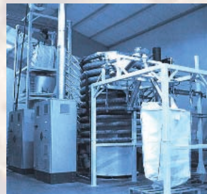
промышленные установки FENIOUX: 250 кг/ч лекарственных растений

Секция сушки и охлаждения системы REVTECH позволяет обеспечить более быструю и эффективную стабилизацию по сравнению с конкурирующими технологиями. Остаточная влажность легко регулируется в зависимости от требуемого уровня. Сухой воздух используется при атмосферном давлении, что устраняет возможность отклонений по причине климатических условий, при этом требуемый объем сушки значительно ниже из-за небольшого количества пара, используемого для стерилизации. Для конечного этапа охлаждения используется система двойной оболочки с охлажденной водой для обеспечения постоянства качества.